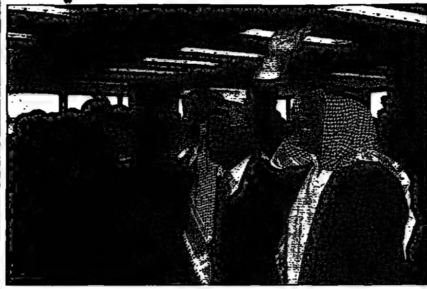
متماملون في سوق عمان المالي امس